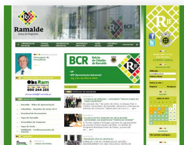
Website da Junta de Freguesia de Ramalde

Procedeu-se ainda à atualização e inserção de novos conteúdos na página de internet (Site) e facebook da Junta de Freguesia de Ramalde, nomeadamente os editais, condicionamentos de trânsito e estacionamento, iniciativas, fotografias e notícias julgadas importantes para a população.