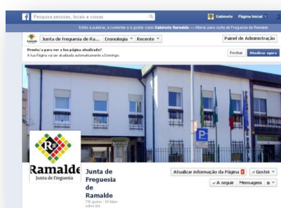
Facebook da Junta de Freguesia de Ramalde